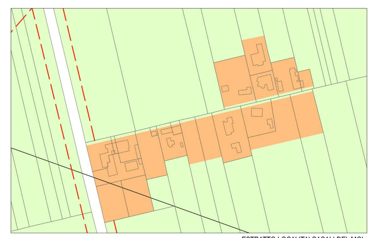
ESTRATTO LOCALITA' CASALI DEL MOL